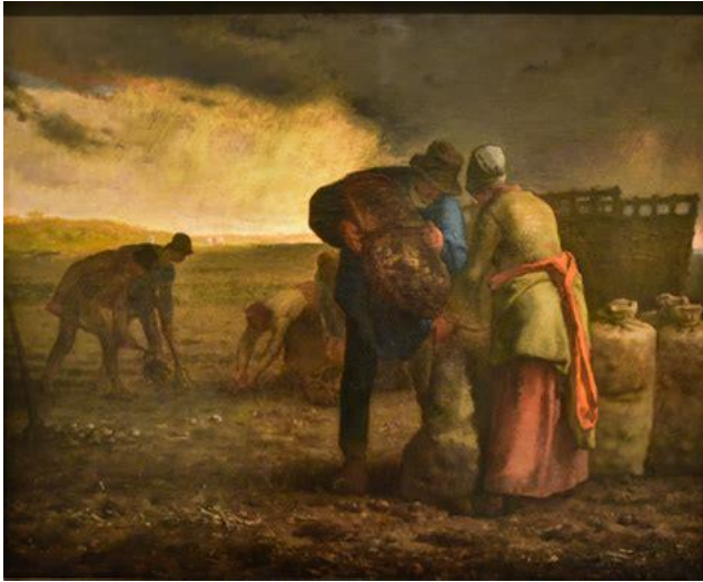
SIMON - La Récolte des pommes