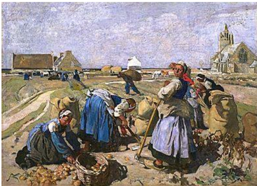
Ernest Higgins Rigg - The Potato Pickers