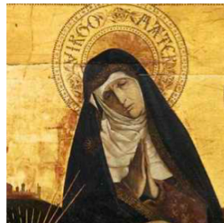
Pietà de Villeneuve lès Avignon, Enguerrand Quarton