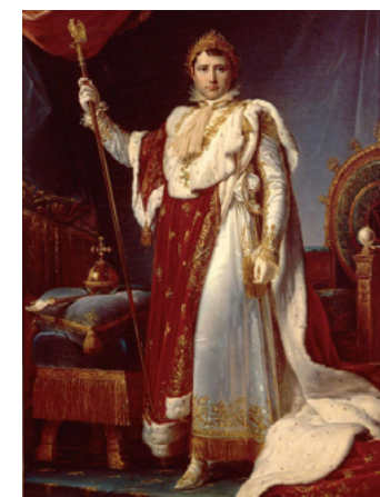
Empereur (Napoléon Ier en costume de sacre, François Gérard - 1805)